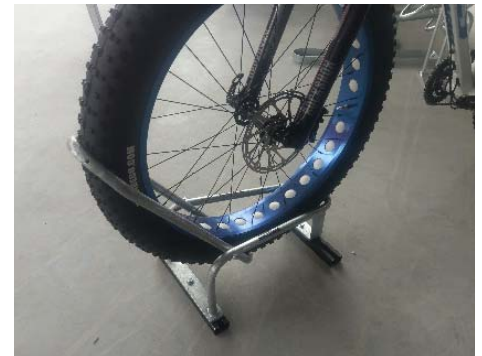
Bild: Variante XL für Fatbikes

Die Stationen werden abwechselnd mit Hoch- und Tiefparker, einreihig oder gegenseitig zusammengestellt.